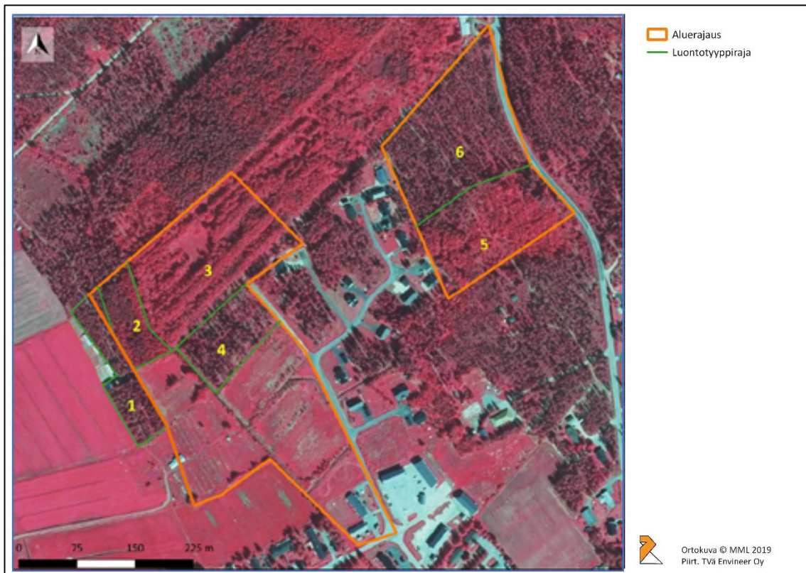
Kuva 1. Kartta alueesta.

Uutelan alueen luontoselvitys suoritettiin 29.8.2019. Selvityksen suoritti luontokartoittaja (EAT) Tuomas Väyrynen Enviineer Oy:stä. Selvitystä on täydennetty toukokuussa 2020 (ks kapale 3).