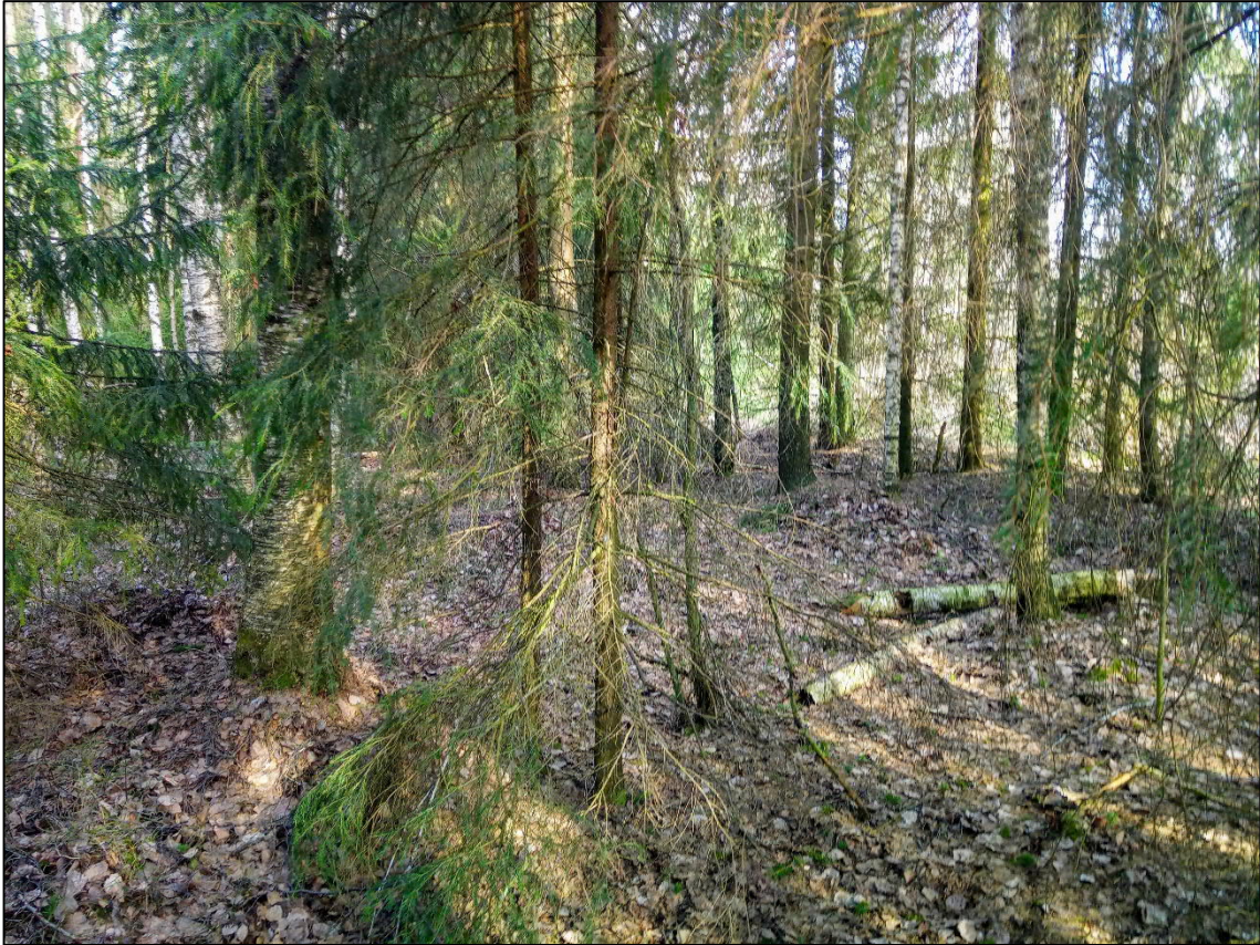
Kuva 4. Kuvion 2 metsikkö toukokuussa 2020.

ja joukossa on jonkin verran koivuja sekä riukumaisia mäntyjä. Ojan varrelta löytyy hieman monipuolisemmin lehtipuustoa. Laji vaatisi selkeästi järeämpää metsää ja sopivia pesimäpaikkoja elinpiiriltään.