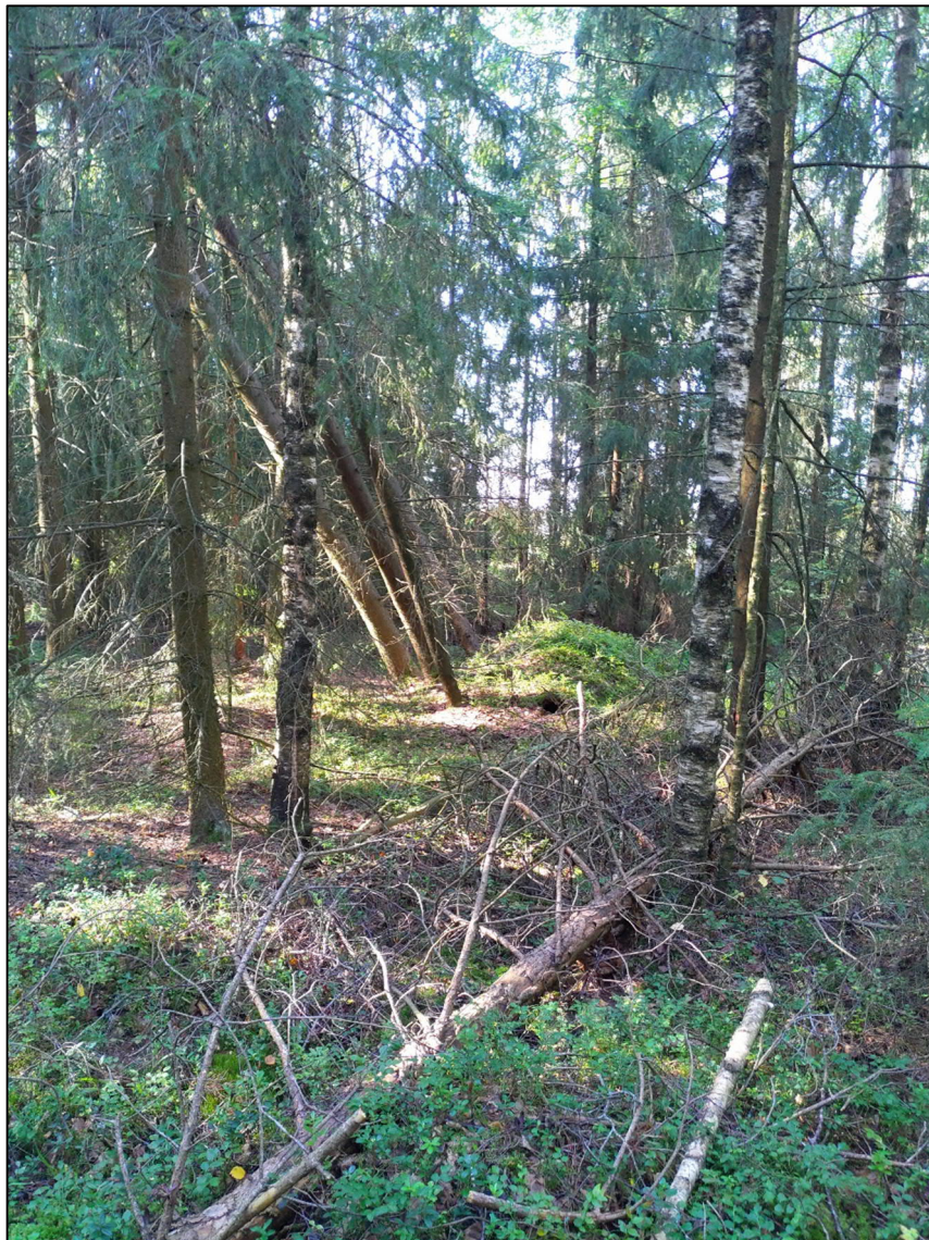
Kuva 2. Kuvion 2 sekametsää.