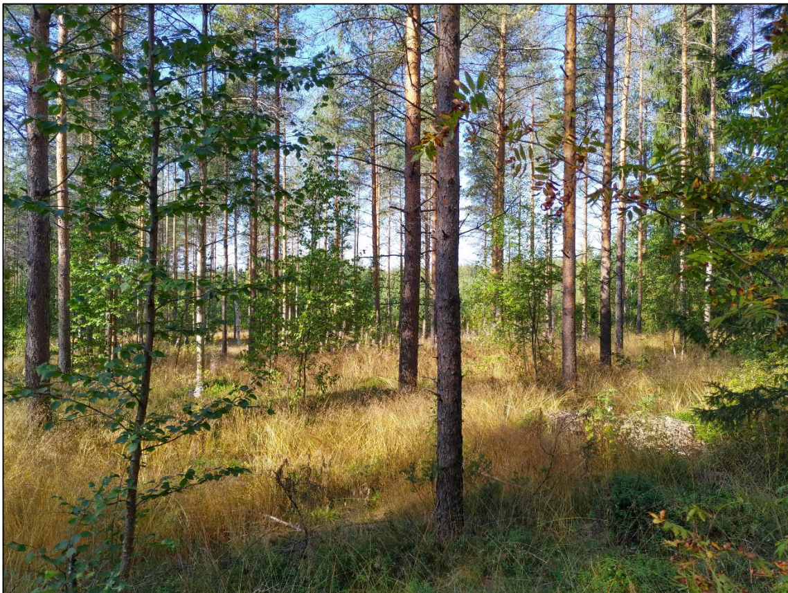
Kuva 3. Kuvion 6 valoisa männymetsä.

Muilta osin tarkastellulle alueelle ei vaikuttaisi sijoittuvan huomionarvoisia kohteita tai lajeja. Alueelta ei löytynyt luonnonsuojelulain tai vesilain suojaamia arvokkaita elinympäristöjä tai metsälain mukaisia erityisen tärkeitä elinympäristöjä. Alueella ei myöskään esiinny suojellisesti arvokkaita lajeja.