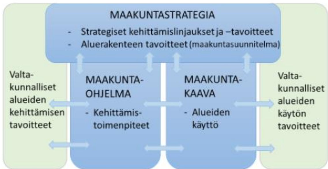
Kuva 2-1. Maakunnan suunnittelujärjestelmä.

Keski-Pohjanmaan maakuntastrategia 2040 ja maakuntaohjelma 2022–2025 on keskipohjalaisten yhteinen näkemys maakunnan kehittämisen tulevaisuuden tavoitetilasta, strategisista linjauksista ja tavoitteista sekä keinoista, joilla nämä tavoitteet saavutetaan. Se perustuu maakunnan mahdollisuuksiin ja tarpeisiin, kulttuuriin ja erityispiirteisiin ja on valmisteltu osallistavassa prosessissa yhteistyössä maakunnan toimijoiden ja yhteistyökumppanien kanssa. Maakunnan suunnitteluun kuuluvat alueiden kehittämislain ja maankäyttö- ja rakennuslain mukaan pitkän aikavälin kehittämisen strategia, maakuntasuunnitelma, alueiden käyttöä ohjaava maakuntakaava sekä keskipitkän aikavälin alueellinen kehittämisohjelma eli maakuntaohjelma (Kuva 2-1).